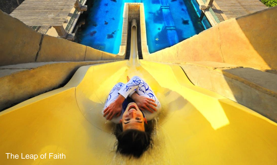
The Leap of Faith