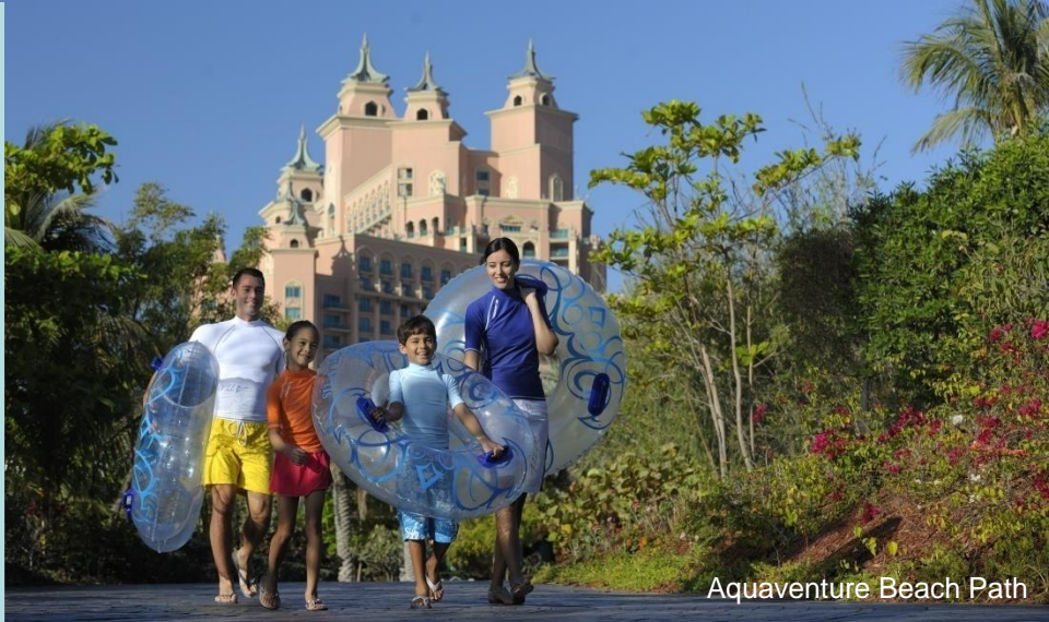
Aquaventure Beach Path