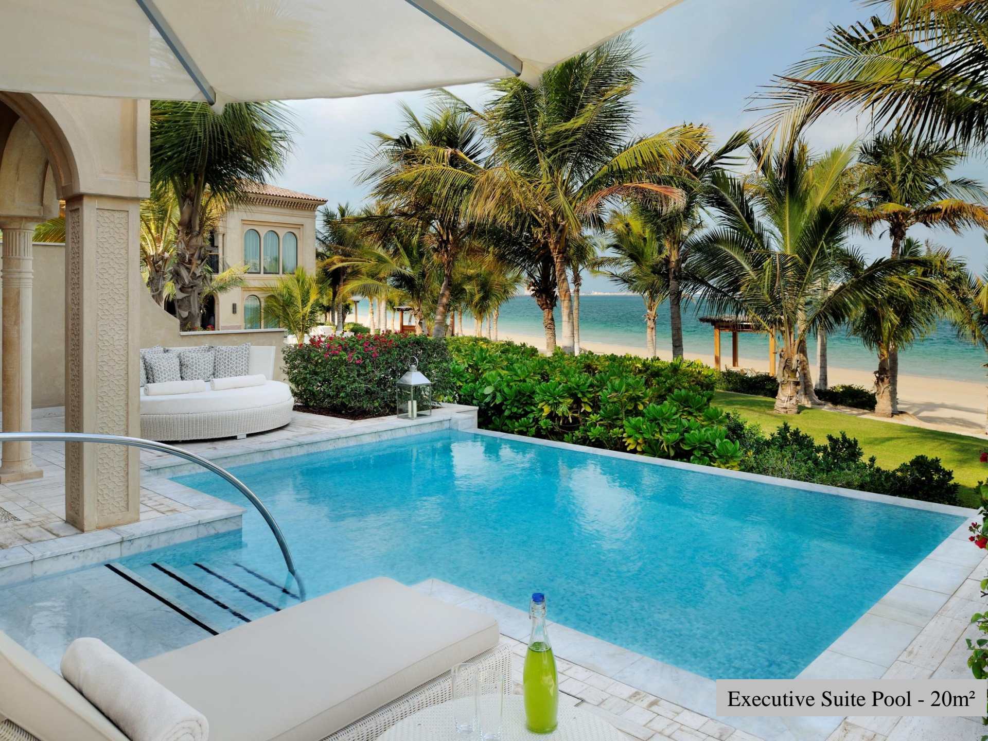
Executive Suite Pool - 20m 2