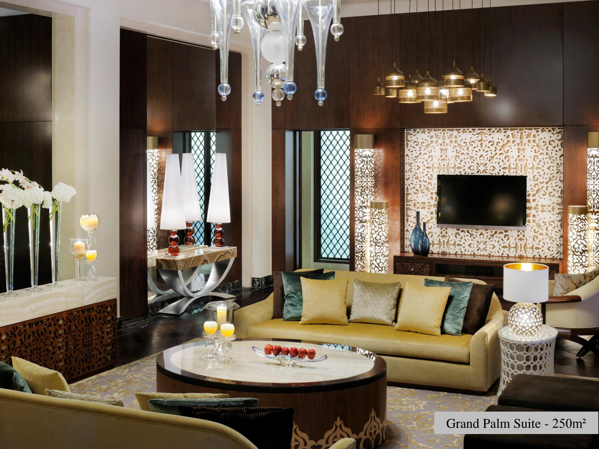
Grand Palm Suite - 250m 2