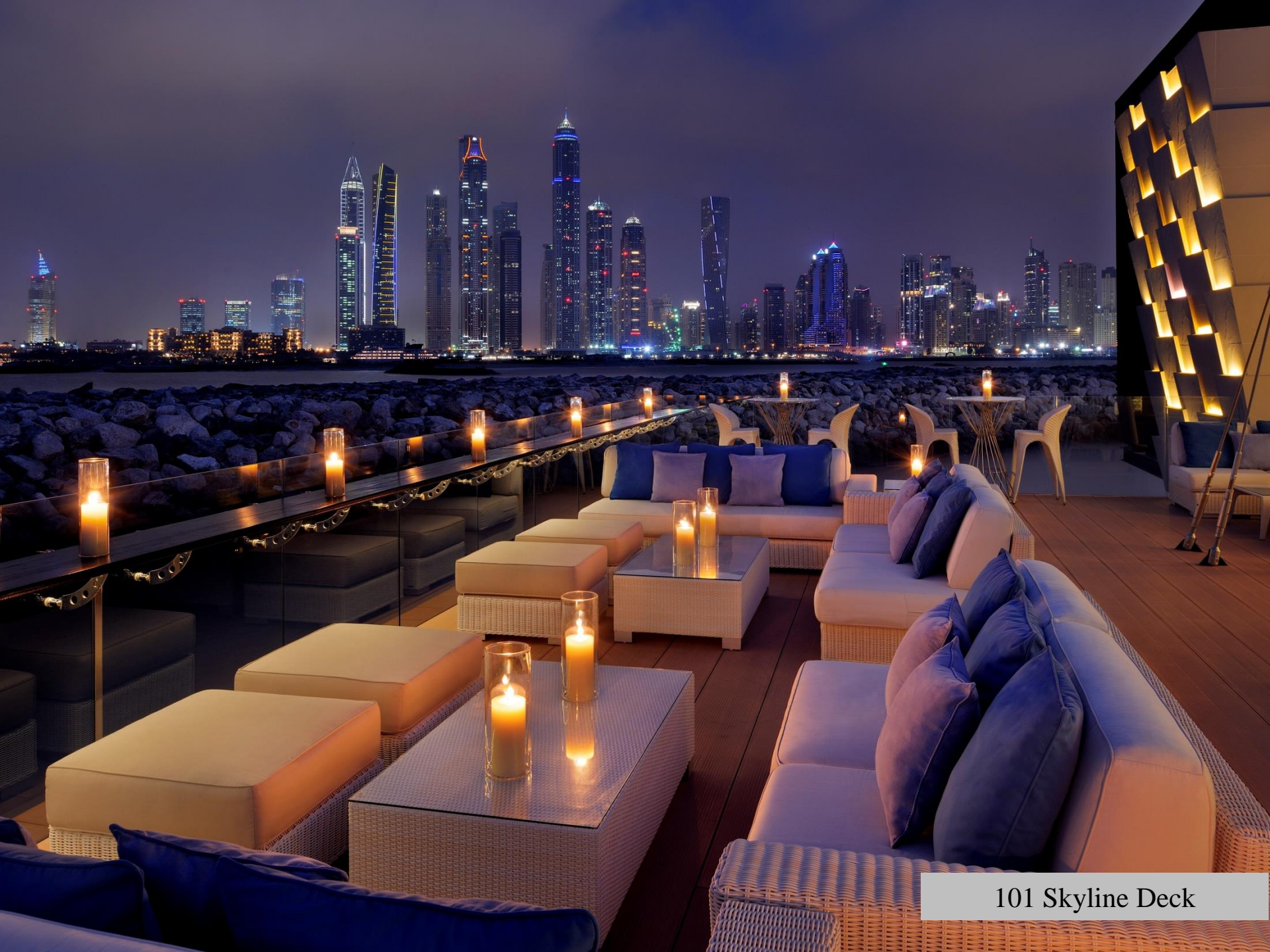
101 Skyline Deck