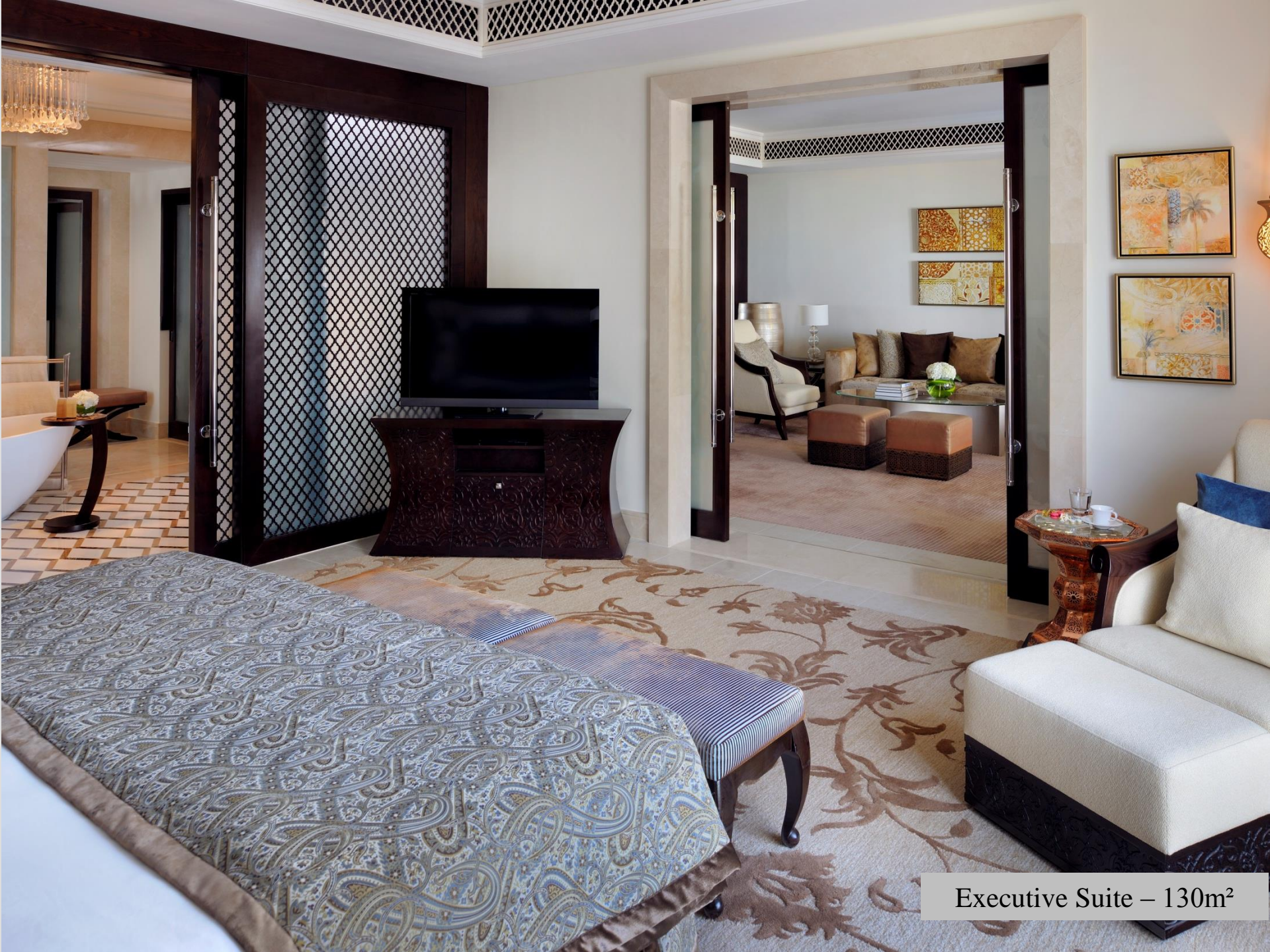
Executive Suite – 130m 2