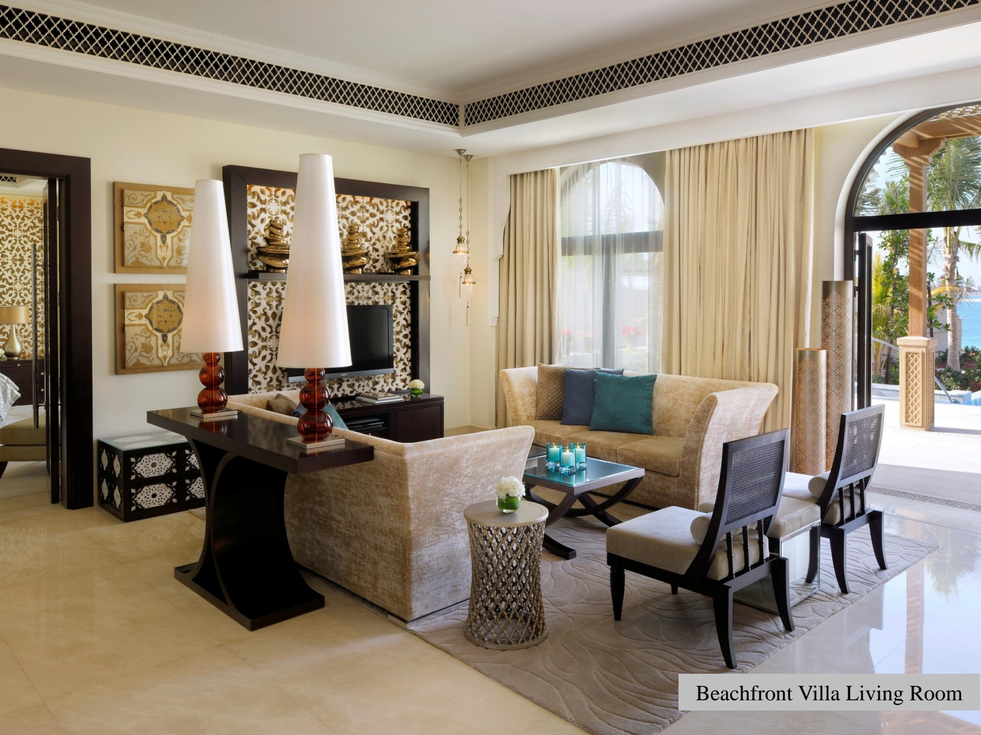
Beachfront Villa Living Room