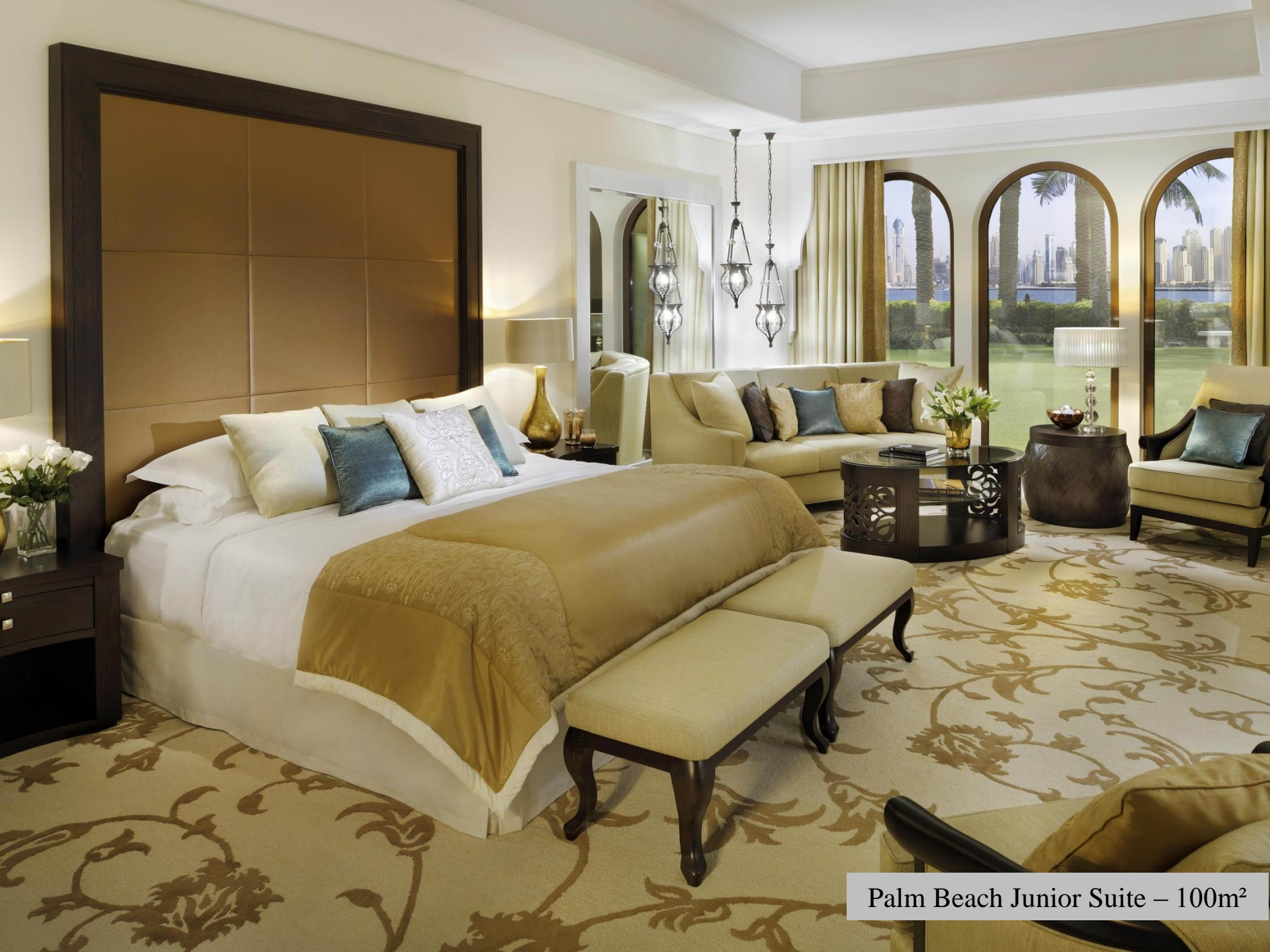
Palm Beach Junior Suite – 100m 2