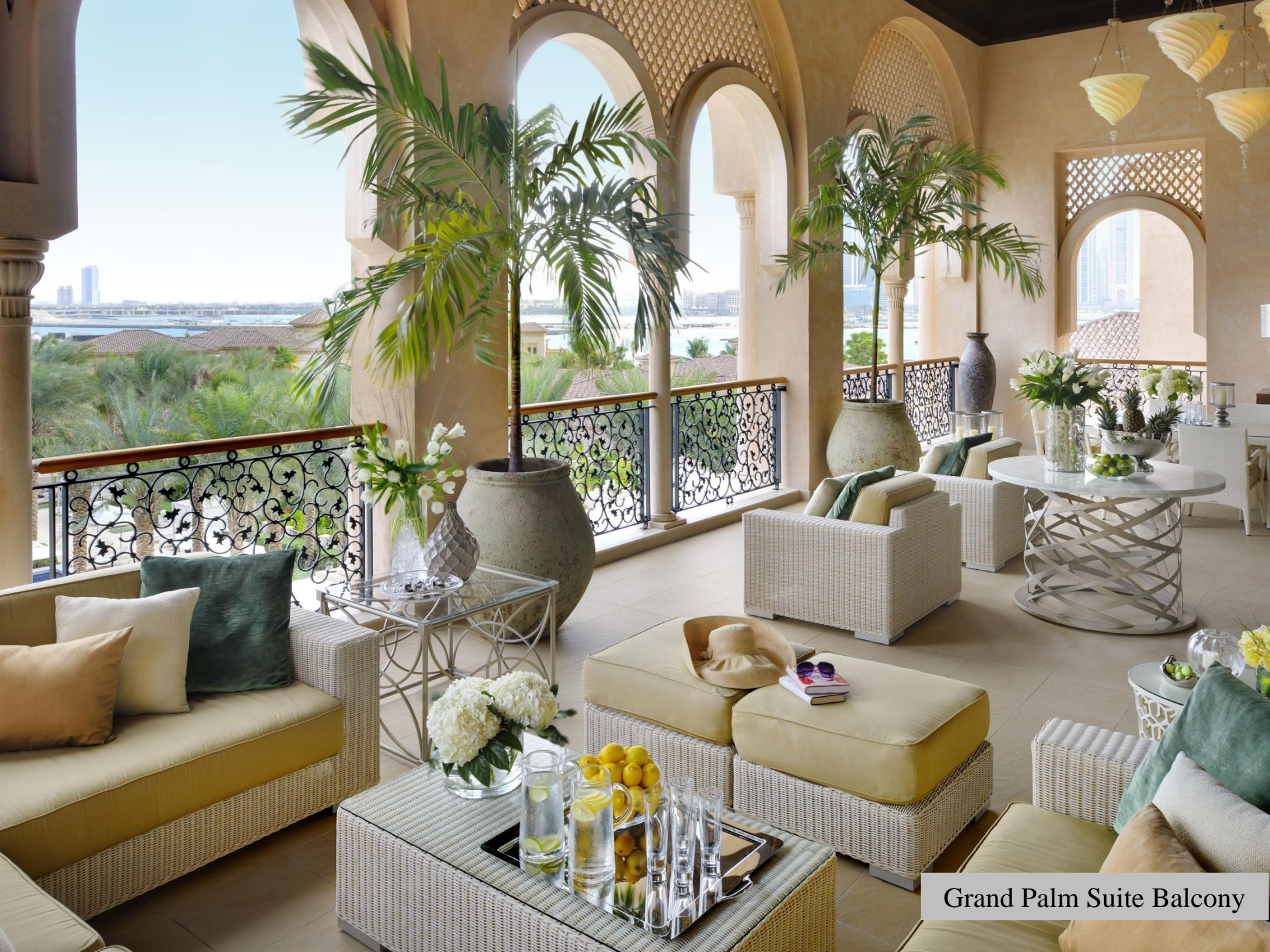
Grand Palm Suite Balcony