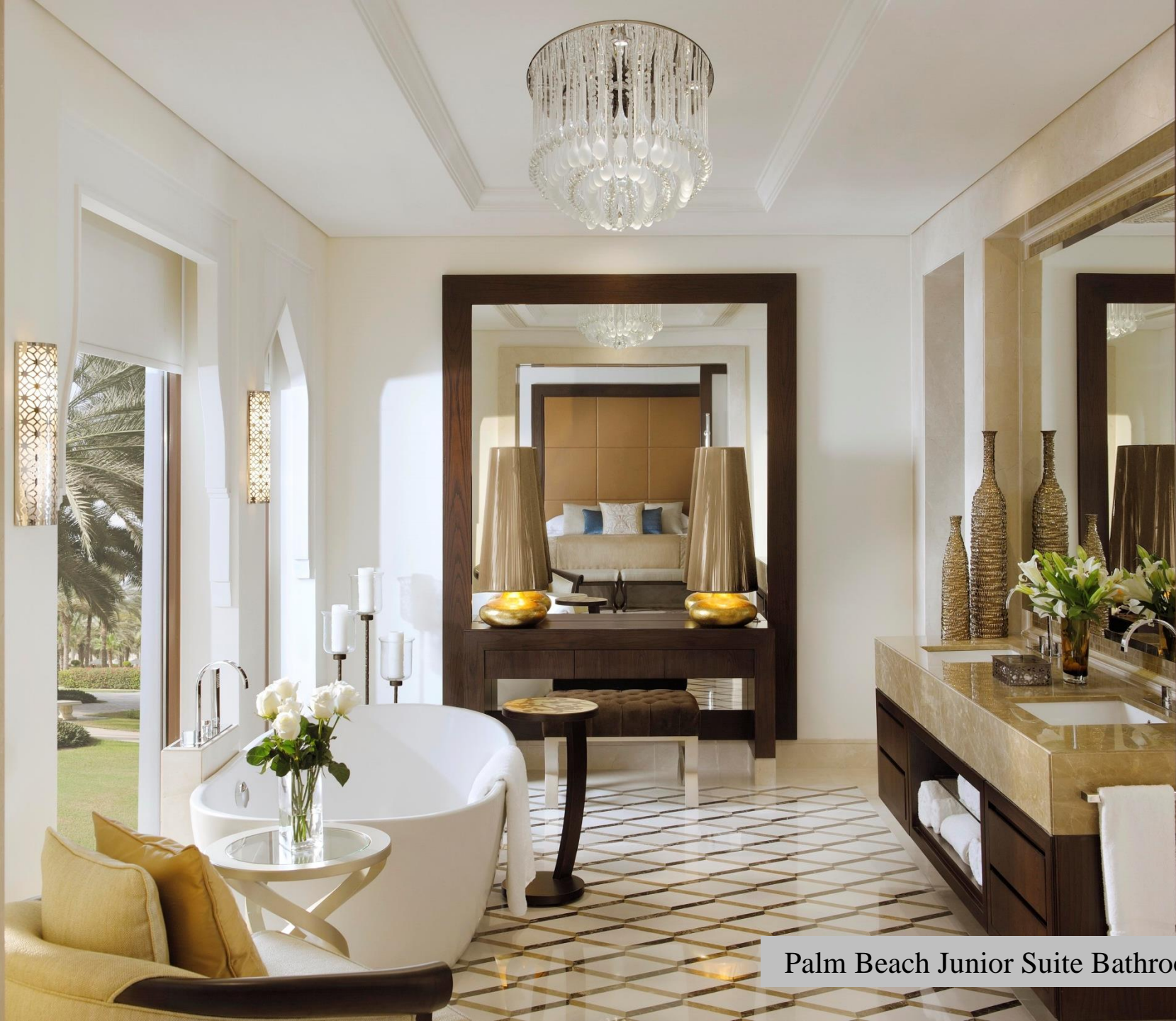
Palm Beach Junior Suite Bathroom