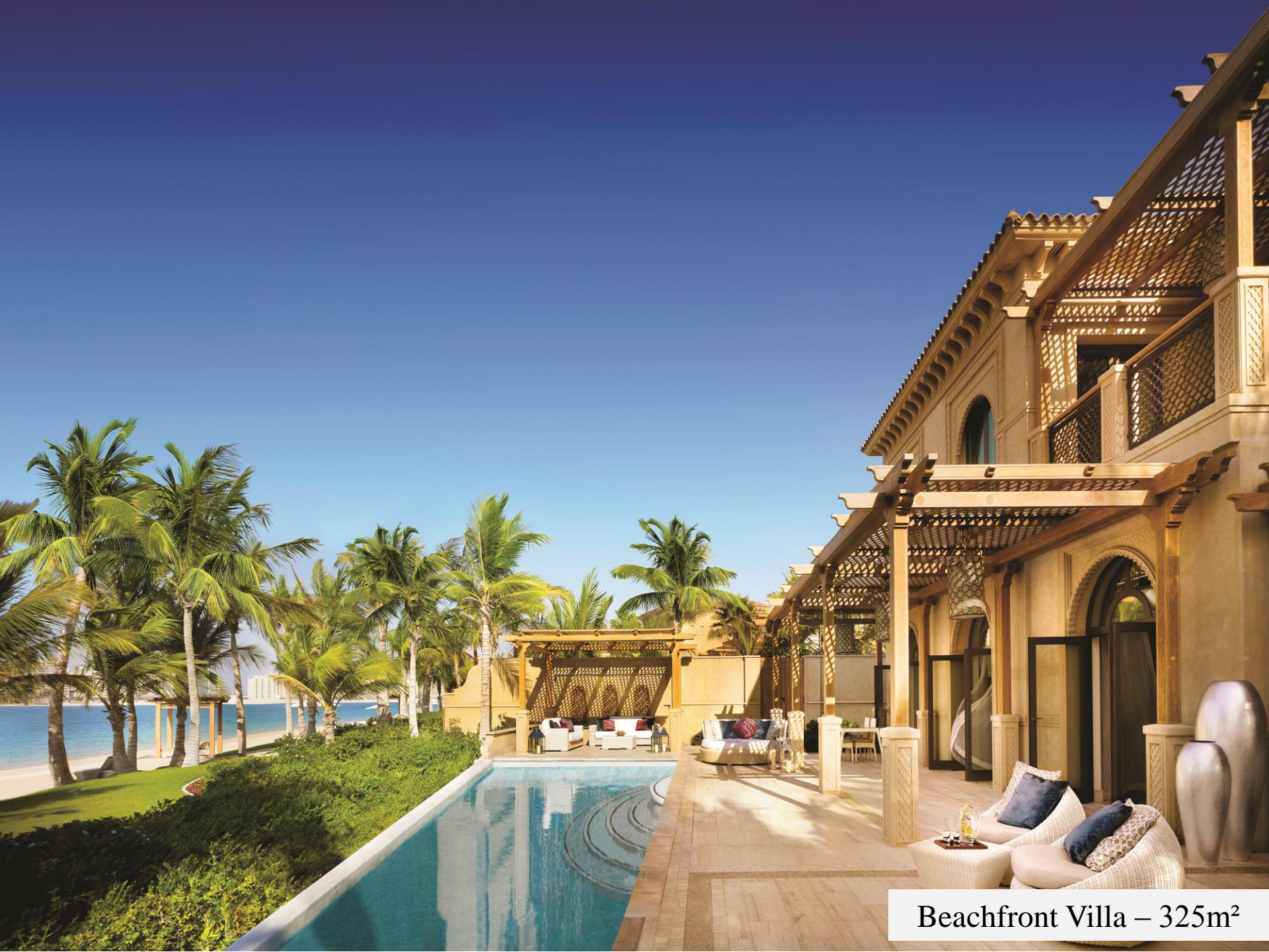
Beachfront Villa – 325m 2