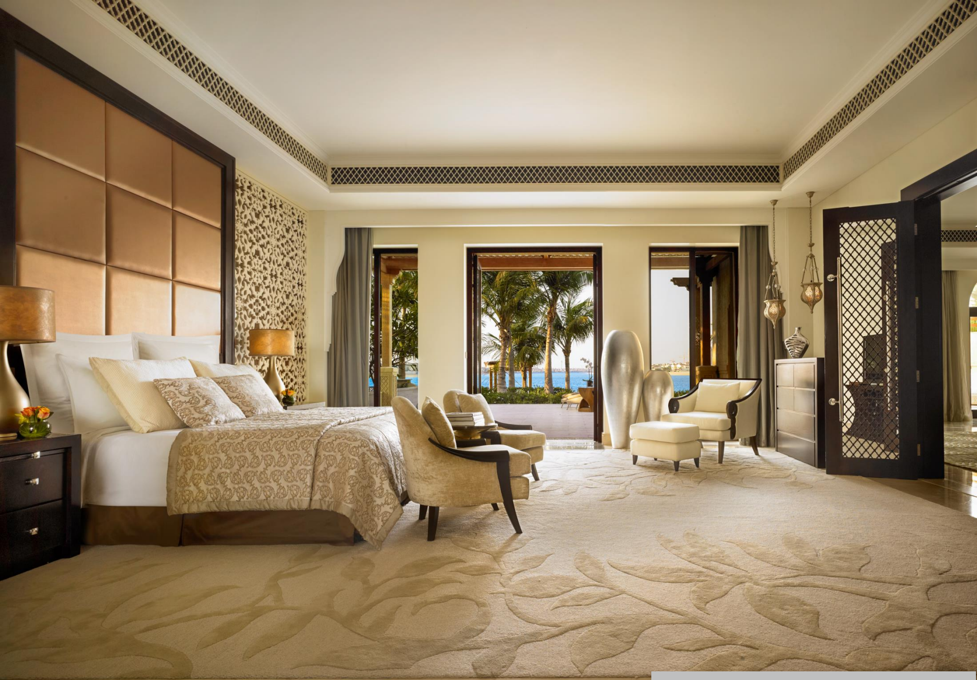
Beachfront Villa Master Bedroom