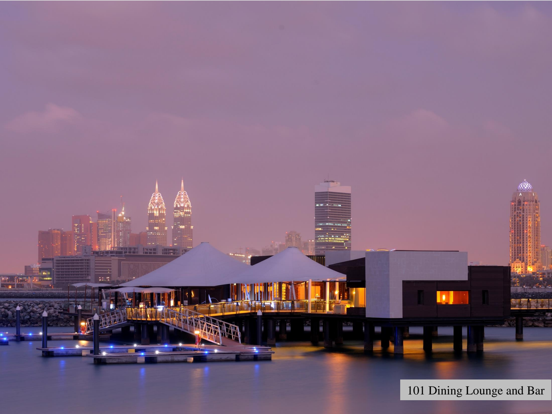
101 Dining Lounge and Bar