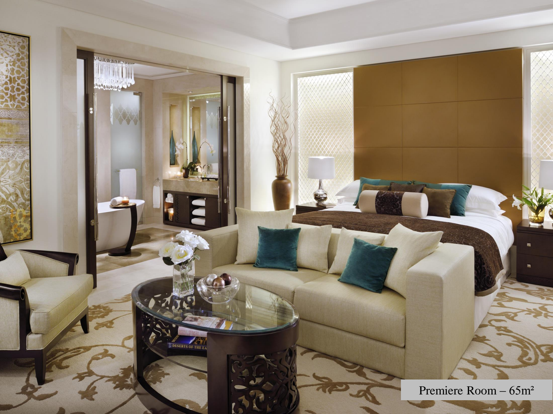
Premiere Room – 65m 2