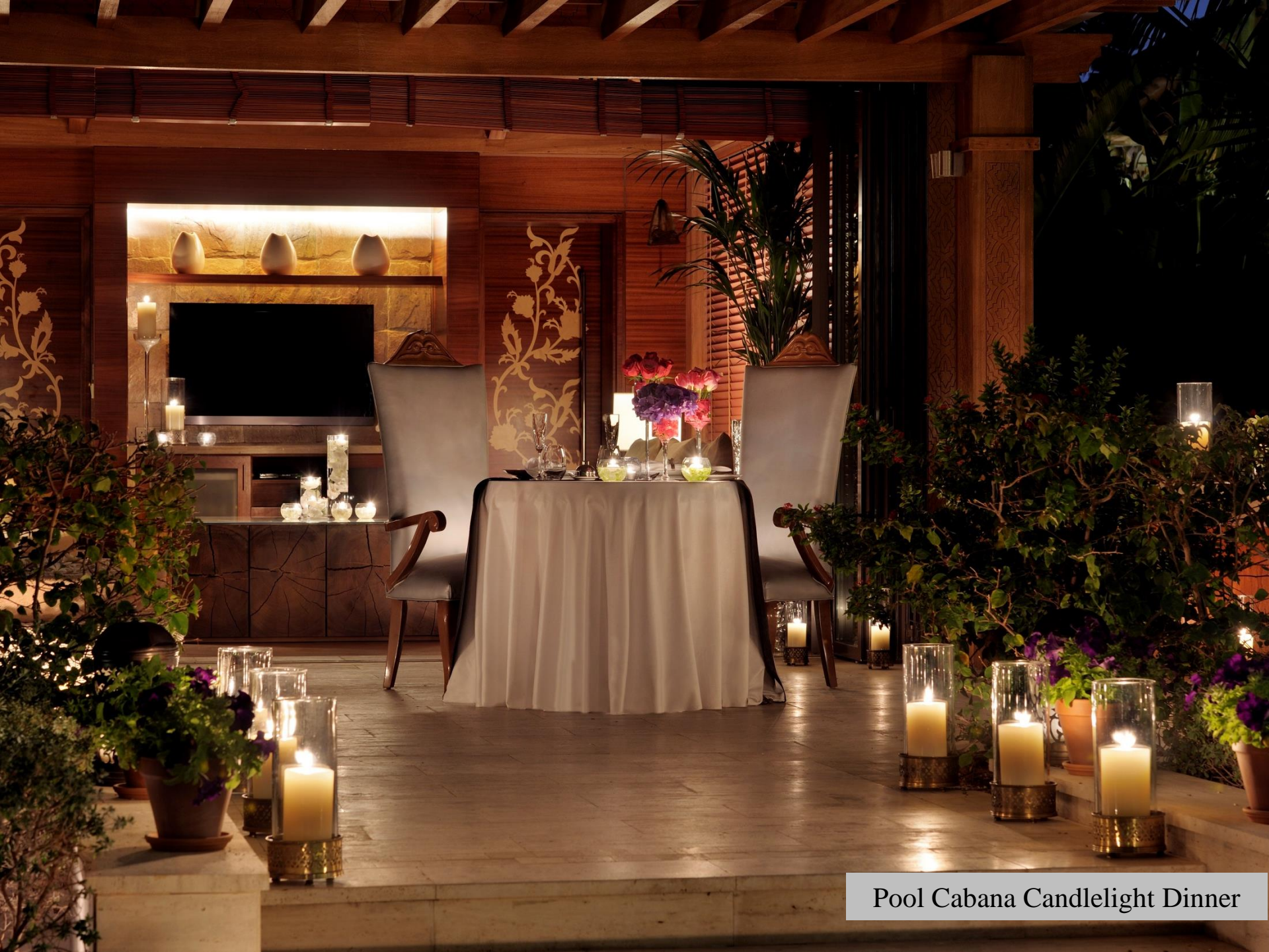
Pool Cabana Candlelight Dinner