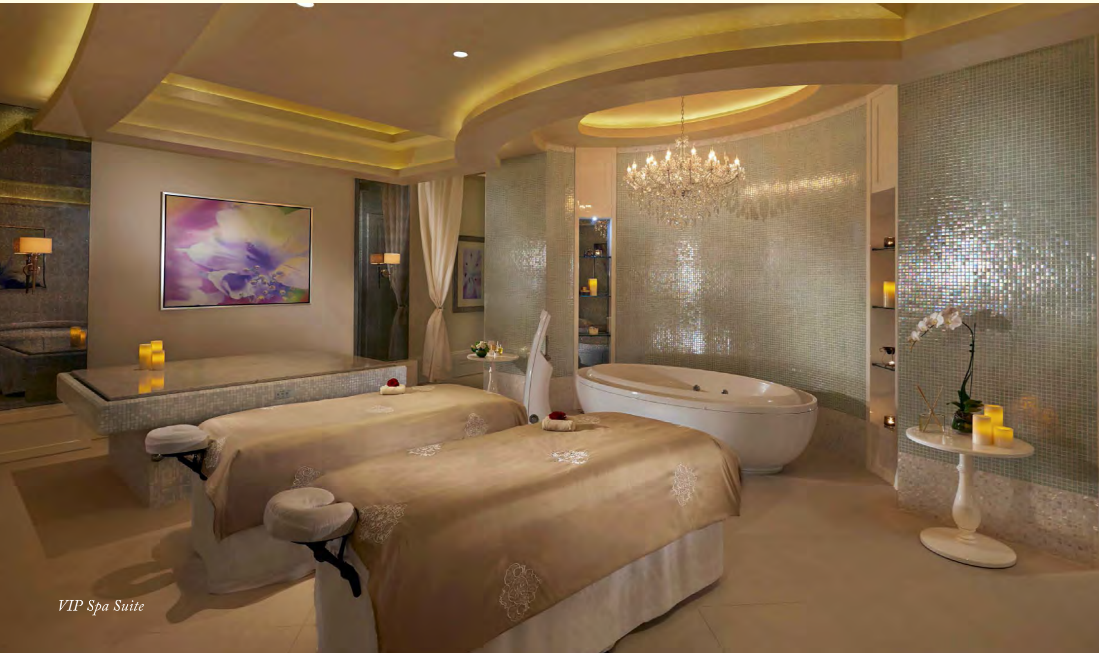
VIP Spa Suite