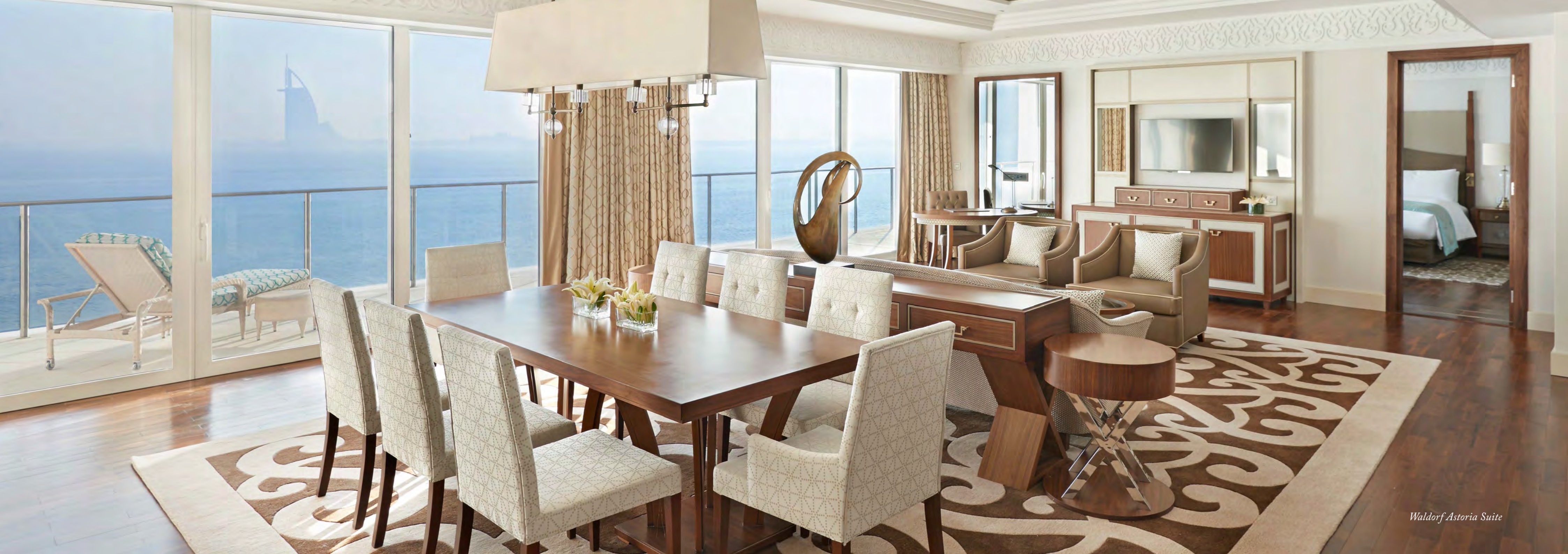
Waldorf Astoria Suite