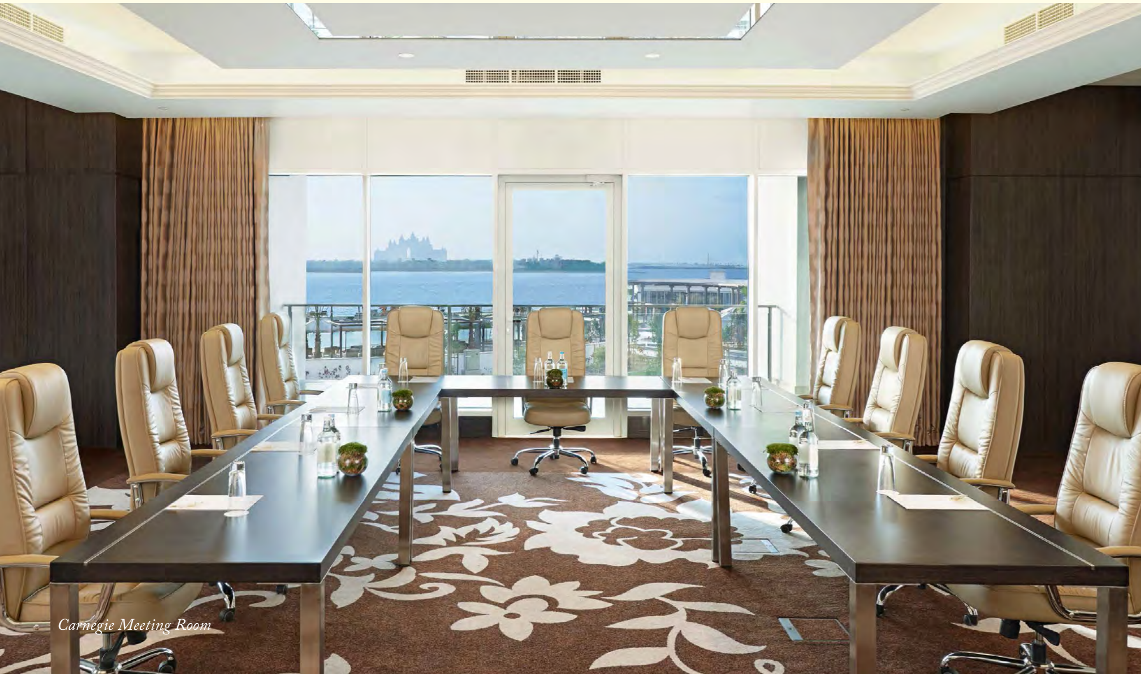
Carnegie Meeting Room